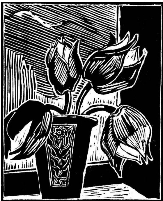
Adomas Matuliaskas vyresnysis, „Vilniaus vandens lelijos“, pop. linoraiž. 35 x 28, 1961.