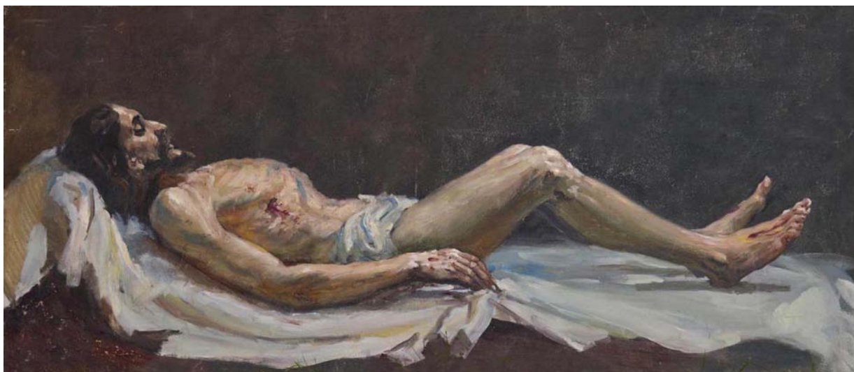
Dailininkas Adomas Matuliaskas vyresnysis, „Gulintis-Kristus“, drobė, aliejus, 100 x 250, paveikslas sukurtas Molėtų Šv. apaštalų Petro ir Povilo bažnyčiai, 1957.